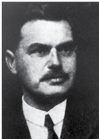
Belák Sándor 1886–1947

A Magyar Reumatológusok Egyesülete vezetősége 2018. december 13-i ülésén arról döntött, hogy új formában szabályozza a Belák-émlékérem adományozásának folyamatát. Az előkészítő munka eredményeként az alábbi dokumentum jött létre, melyet a vezetőség helyben hagyott. Az Alapító Okiratot – mely korábban már megjelent – újra közöljük az adományozási folyamat leírásával és az objektív értékelést lehetővé tevő adatlappal együtt.